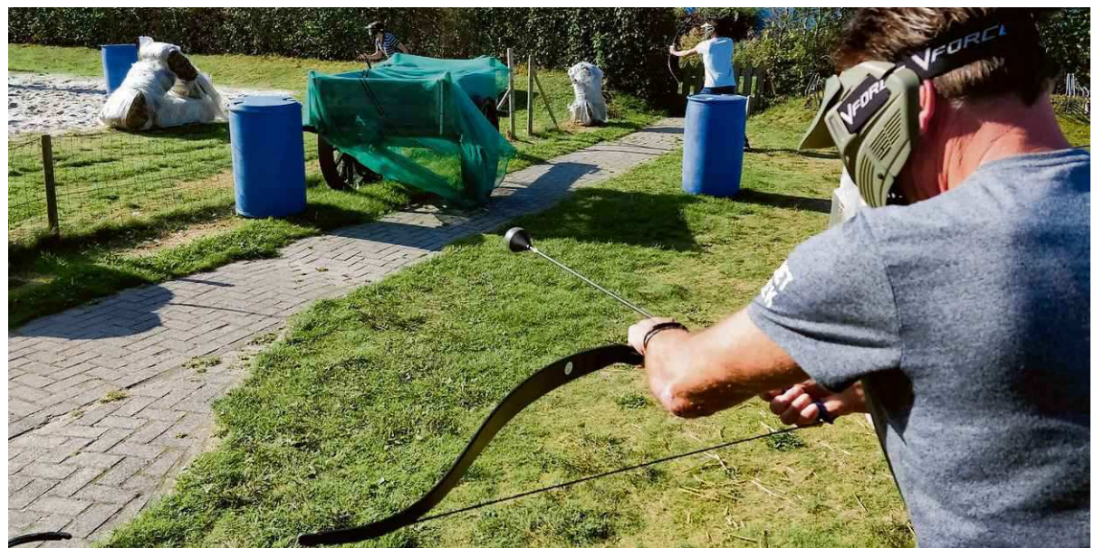
Op de pijlen bij Archery Tag zitten rubberballetjes, zodat ze niet te hard aankomen.