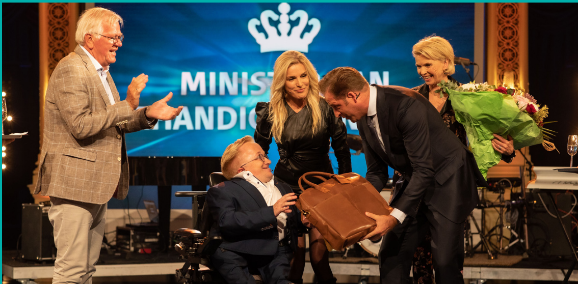
Rick Brink wordt uitgeroepen tot Minister van Gehandicaptenzaken