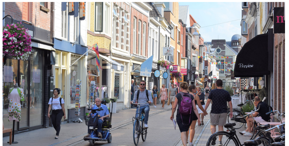
De Folkingestraat: Eén van de shared spaces in Groningen

Hoewel het idee hierachter is dat iedereen goed oplet en dat er voorzichtig gefietst en gereden wordt, zijn er velen die gehaast er doorheen proberen te komen. Dit kan soms leiden tot flinke schrikreacties als je ineens ingehaald wordt door een fietser, of iemand heel dicht langs je komt.