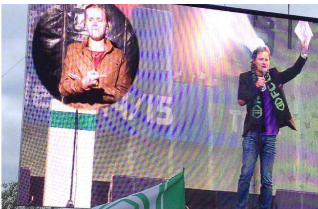
Gebarentolk in actie bij de beker-huldiging van FC Groningen.